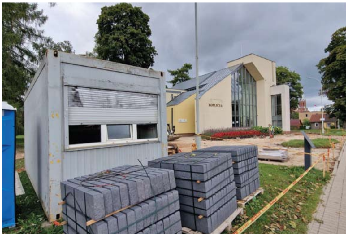
Anykščių koplyčios teritorijos renovacijos projekto kaina – 325 tūkst. 735 Eur.