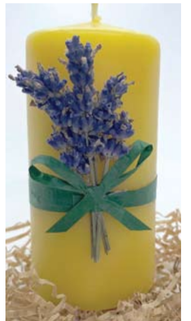
Rankų darbo natūralaus bičių vaško žvakės degdamos skleidžia medaus kvapą.

„Priklauso, kokio dydžio jos yra. Galima pagaminti per dieną ir pusę šimto žvakių“, – sakė ji.